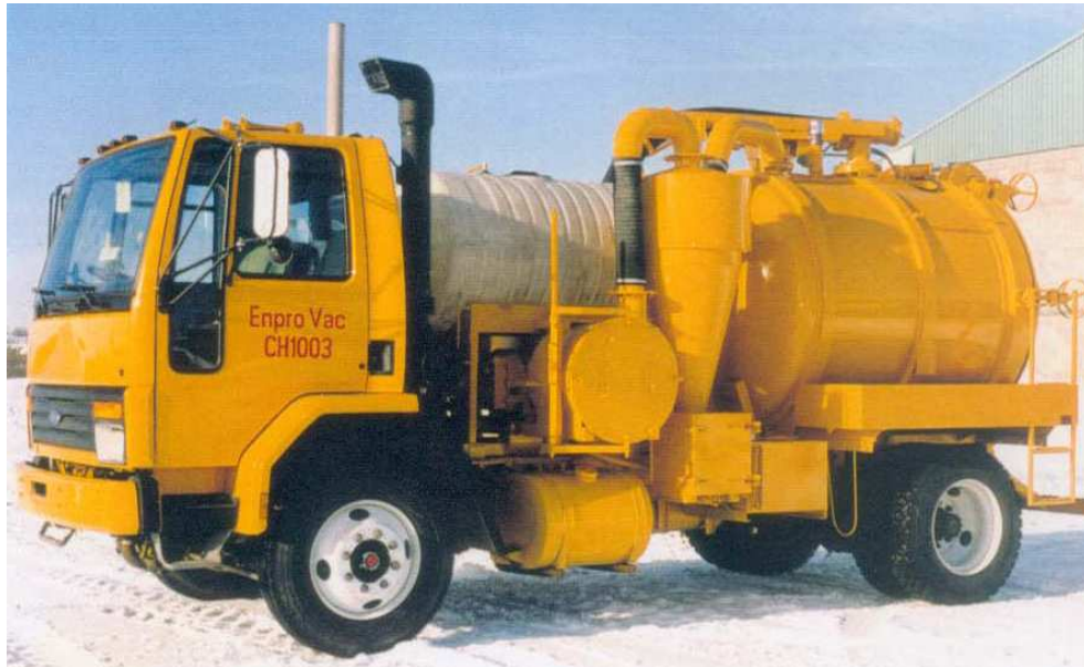
Planche Application.....Planche Application

Surpresseur à pistons rotatifs Higon à injection d'air VTB 820, installé sur camion pour l'entretien des réseaux d'assainissement.