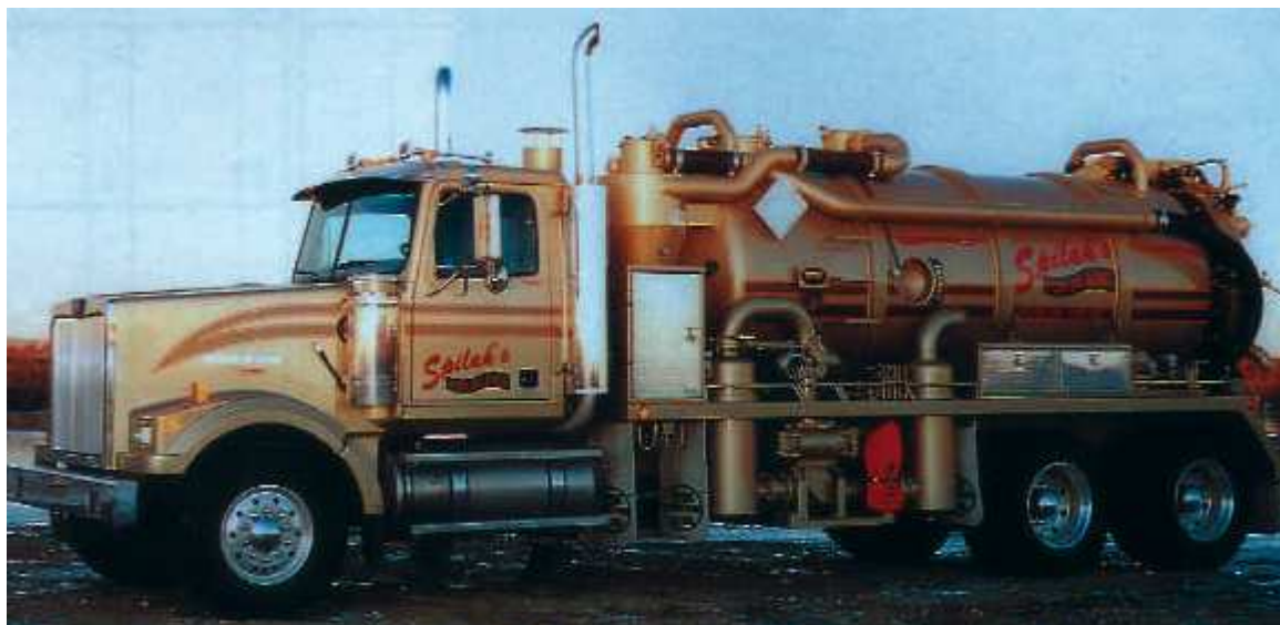
Planche Application.....Planche Application

Surpresseur à pistons rotatifs Hibon à injection d'air VTB810 et VTB820, installé sur camion pour le nettoyage de cuves de décantation de pétrole brut.