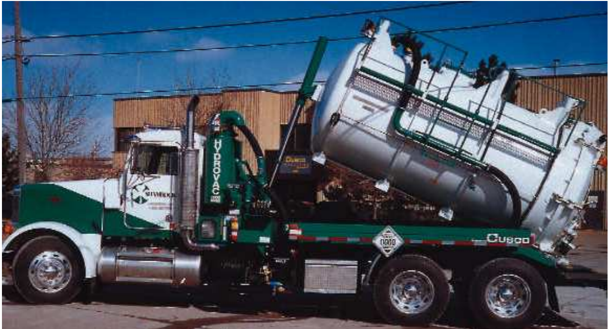
Planche Application.....Planche Application

Surpresseur à pistons rotatifs Hibon à injection d'air SIAV 6, installé sur camion de nettoyage de résidus chimiques ou pétroliers en zone explosive.